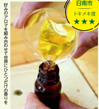
好みのアロマを組み合わせて世界にひとつだけの香りを