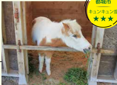
食欲旺盛なポニー。白と茶色の毛並みがキレイ

豊かな自然に囲まれ、動物たちとのふれあいが楽しめるスポット。小学生までは500円でポニーの乗馬体験ができます。また、イヌやネコ、ウサギなど小動物とのふれあいコーナーも。ウサギのエサやり体験もできます。広々とした園内で、散歩したり、お弁当を食べたり、憩いの時間が過ごせます。