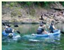
エアーカヌー“DUCKY”で川下り

西米良村大字村所125-12 ☎0983-36-1305 図チェックイン16:00/チェックアウト10:30(デイキャンプ11:00~14:00) 図なし 図1泊大人1万6500円・子ども5500円。DUCKY体験5500円(要予約)