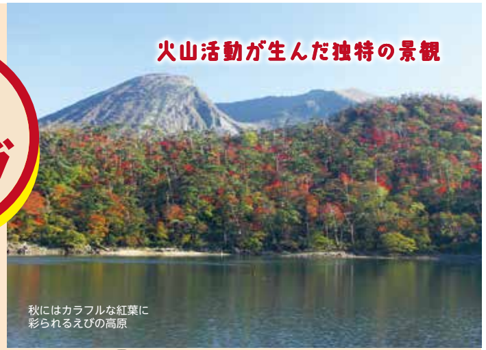
秋にはカラフルな紅葉に彩られるえびの高原