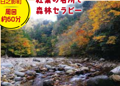
清流と紅葉の見事なコントラスト