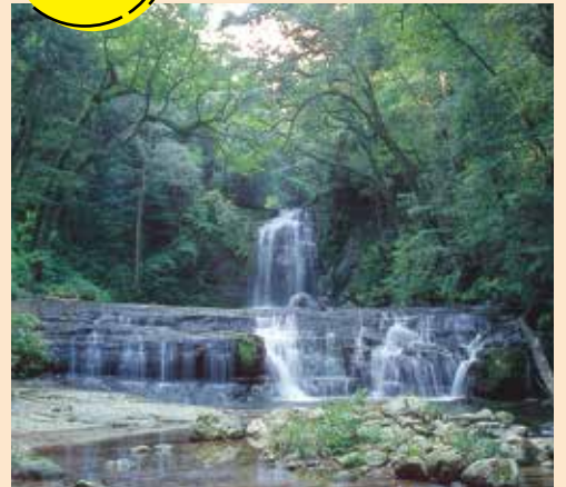
五重の滝、マイナスイオンがたっぷり