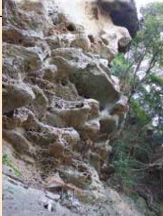
奇岩・巨岩の景観に圧倒される