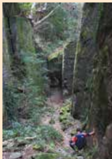
図 宮崎市森林水産課 ☎0985-21-1919

標高 509mとコンパクトな低山ながら変化に富んだ景色と登山の醍醐味を味わえる双石山には、いくつかの登山ルートがあります。「天狗岩」や「象の墓場」などの巨岩や奇岩が特徴的で、修験の山としての歴史もありハシゴやロープを使う場所も。大岩の上から見る市街の展望は最高です。