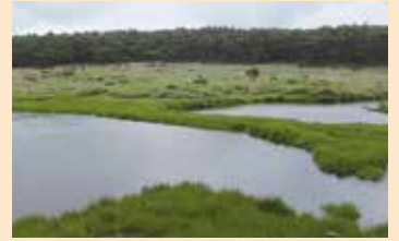
甕岳の火口湿原はビューポイントがいっぱい